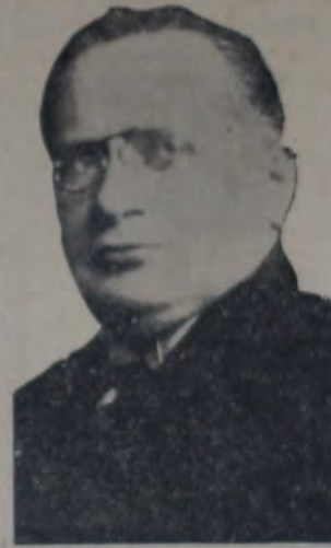
EL DELEGADO DEL SOVIET M. Litvinov, cuya propuesta relativa al empleo de gases venenosos y bacterias, fué aprobada por la comisión preparatoria de la conferencia del desarme.

GINEBRA, 23 — Durante la sesión secreta de la conferencia preliminar de desarme, se aprobó la proposición belga que prohíbe el uso de los gases venenosos, bajo condiciones de reciprocidad, como asimismo el empleo de métodos bacteriológicos en la guerra. También aprobó la moción soviética instando a los gobiernos a que ratifiquen a la brevedad posible el protocolo de Ginebra de 1925, que también prohíbe el empleo de los gases venenosos y los métodos bacteriológicos en tiempo de guerra.