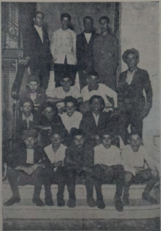
GRUPO DE MENORES HUELGUISTAS QUE ANOCHE NOS VISITO

PARA HOY Obreros Panaderos de Ciudadela. — A las 9 horas, en el local calle Muñoz y Lubter (Ciudadela), para tratar el siguiente orden del día: 1o. Lectura del acta anterior; 2o. Asunto telefónico; 3o. 1o. de Mayo; 4o. Asuntos varios.